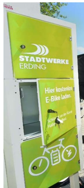
s.o. E-Bike Ladestation Schwimmbad Erding, Am Stadion.

Als E-Bike Besitzer können Sie ihre Akkus an den Ladestationen am Schwimmbad außerdem kostenlos aufladen.